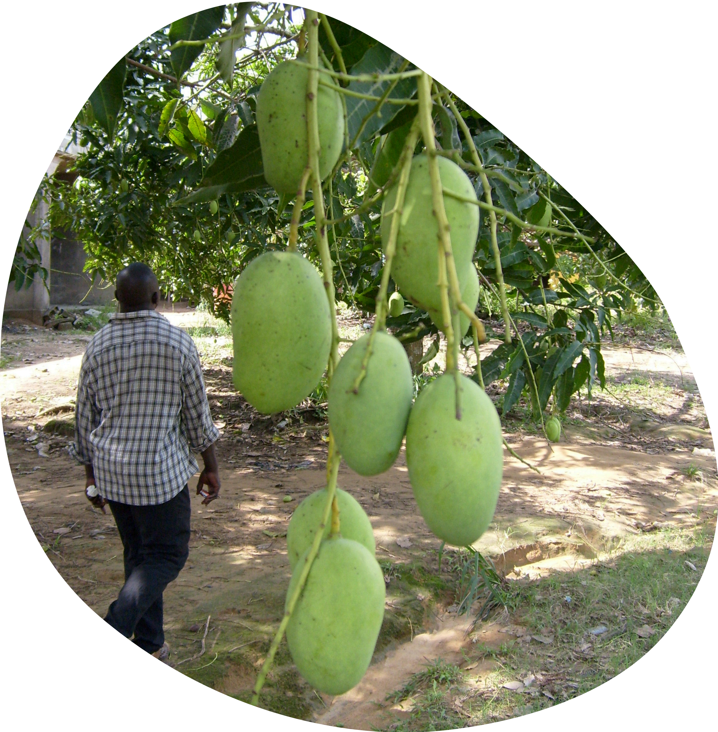
Certificat pour opérateurs, groupements d'opérateurs et exportateurs dans les pays tiers pour les produits biologiques à importer dans l'Union européenne

La papaye est certifiée biologique depuis des années. L'interdiction d'importation de la papaye entre 2023 et 2024 a fortement impacté les volumes de ventes. Depuis la reprise des importations en avril 2024, les volumes ne sont jamais revenus au niveau de 2022, rendant la certification biologique proportionnellement trop chère par rapport au volume de vente. De ce fait, les champs de papayes sortent progressivement de la certification biologique, tout en maintenant les exigences de qualité.